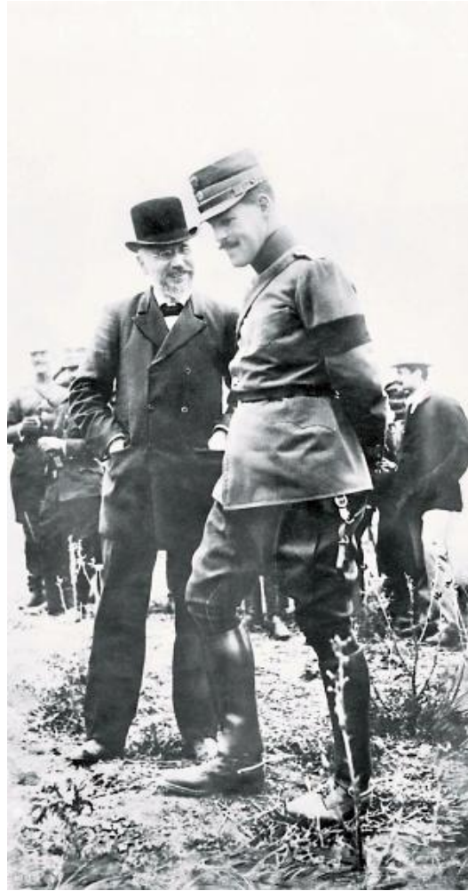
Ο Βενιζέλος και ο Κωνσταντίνος.

ουδετερότητα και συγκρουσιακή αποστασιοποίηση από τις μεγάλες δυνάμεις. Η ένταση αυτή έφτασε στο αποκορύφωμά της στον Εθνικό Διχασμό, όπου η ελληνική κοινωνία διχάστηκε με οδυνηρές συνέπειες. Παρά τον προσωπικό κίνδυνο και την πολιτική πώλωση, ο Βενιζέλος παρέμεινε σταθερός στις αρχές του· η πίστη του στην ευρωπαϊκή ολοκλήρωση της Ελλάδας υπερέβαινε τις στιγμιαίες πολιτικές συγκρούσεις.