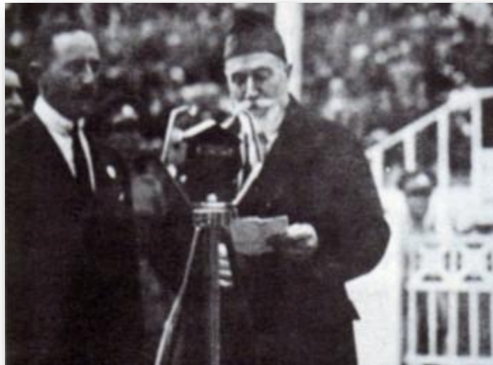
5 Σεπτεμβρίου 1910, ο Ελευθέριος Βενιζέλος κατά τον πρώτο λόγο του προς το λαό των Αθηνών από την πλατεία Συντάγματος

Με την επικράτηση του Ελευθερίου Βενιζέλου και του κόμματος των Φιλελευθέρων στις εκλογές του Νοεμβρίου 1910, ανοίγει ο δρόμος προς τις μεταρρυθμίσεις εκείνες που θα οδηγήσουν βαθμιαία προς τον αστικό μετασχηματισμό της ελληνικής κοινωνίας. Παράλληλα, γίνονται τα πρώτα βήματα για τη δημιουργία ενός σύγχρονου αστικού κράτους κατά τα πρότυπα των δυτικών δημοκρατιών. Παρά τις προκλήσεις και τις αντιξοότητες της εποχής του, ο Βενιζέλος αντιλαμβανόταν ότι η εθνική πρόοδος δεν μπορεί να στηρίζεται αποκλειστικά σε εδαφικές επεκτάσεις, αλλά κυρίως σε ισχυρούς θεσμούς. Γι' αυτό και έδωσε ιδιαίτερη έμφαση στον θεσμικό εκσυγχρονισμό της χώρας, θεωρώντας τον βασικό πυλώνα για την ανάπτυξη ενός σύγχρονου κράτους. Κορυφαία στιγμή αυτής της προσπάθειας υπήρξε η αναθεώρηση του Συντάγματος το 1911, η οποία αποτέλεσε κομβικό σημείο για την πολιτική και κοινωνική εξέλιξη της Ελλάδας (Κουτρούλης, 2010).